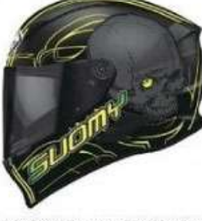
#SVR0012 AMLET YELLOW